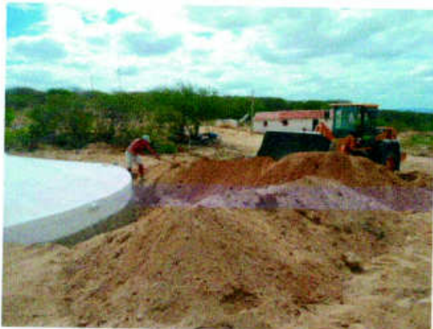
Apoio no aterro dos Cisternões