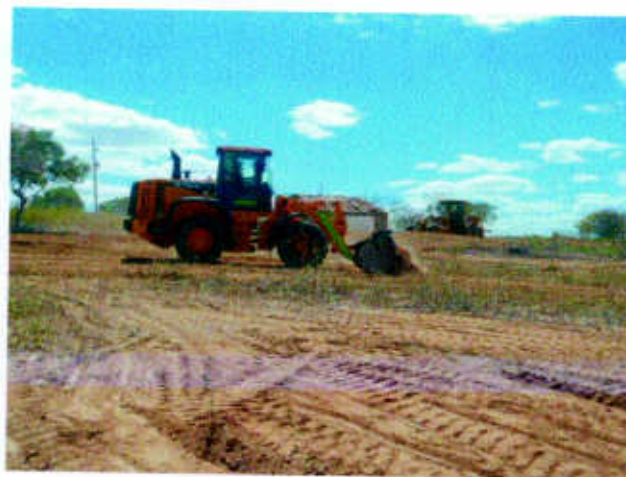
Recuperação das estradas principais e vicinais