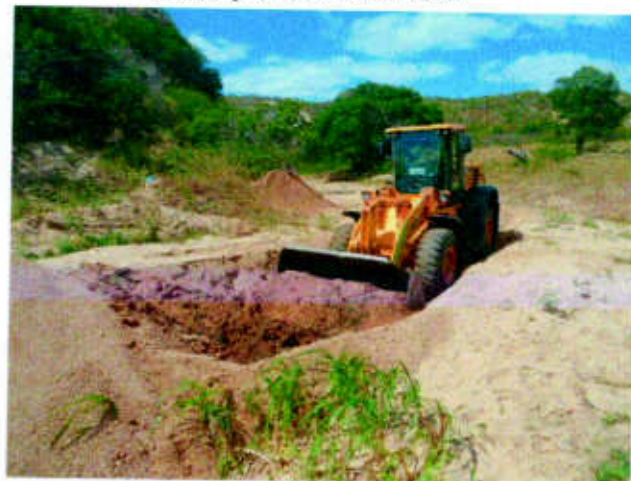
Escavações de cacimbas